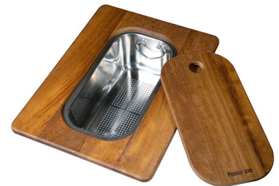
Tabla de corte Twin de madera iroko con escurrir pasta en acero inoxidable

* sólo en combinación con el accesorio 8644 101