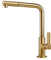
VELA PLUS GOLD satinado 8498 129